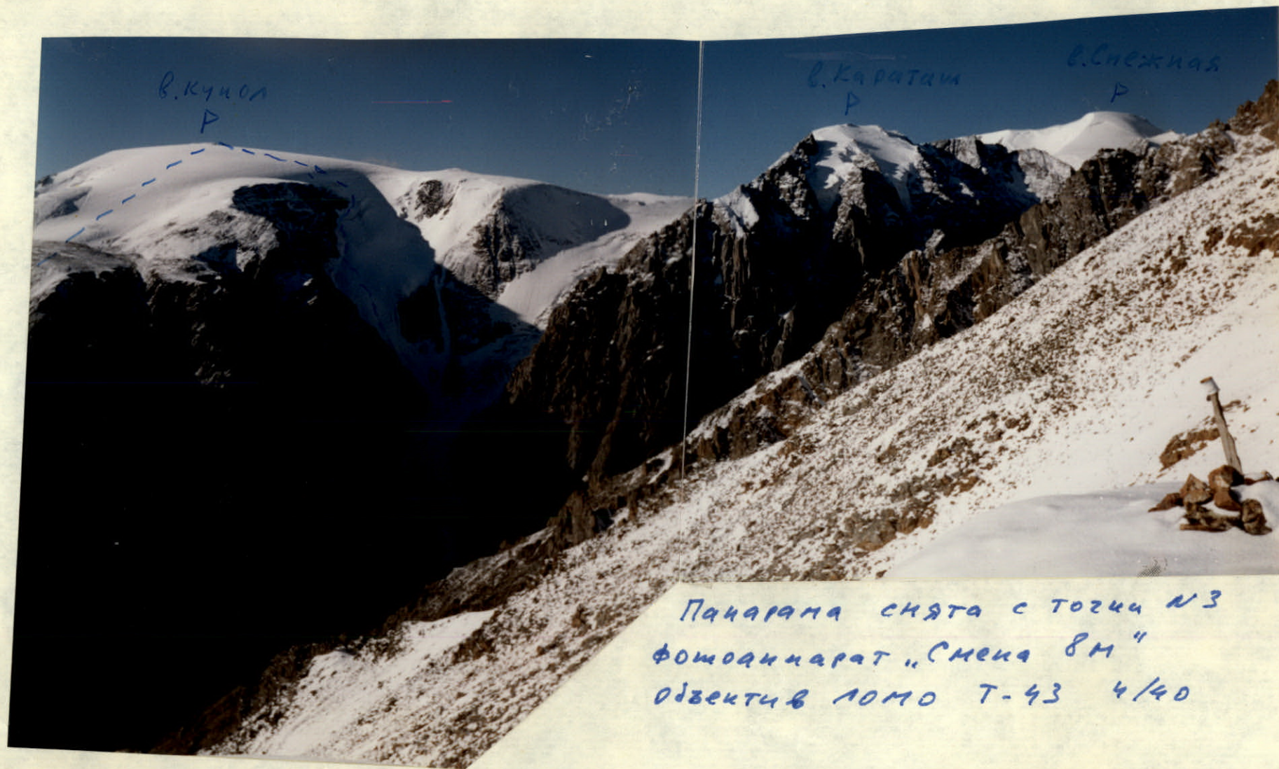
Панорама снята с точки №3 фотоаппарат "Смена 8М" объектив ЛОМО Т-43 4/40