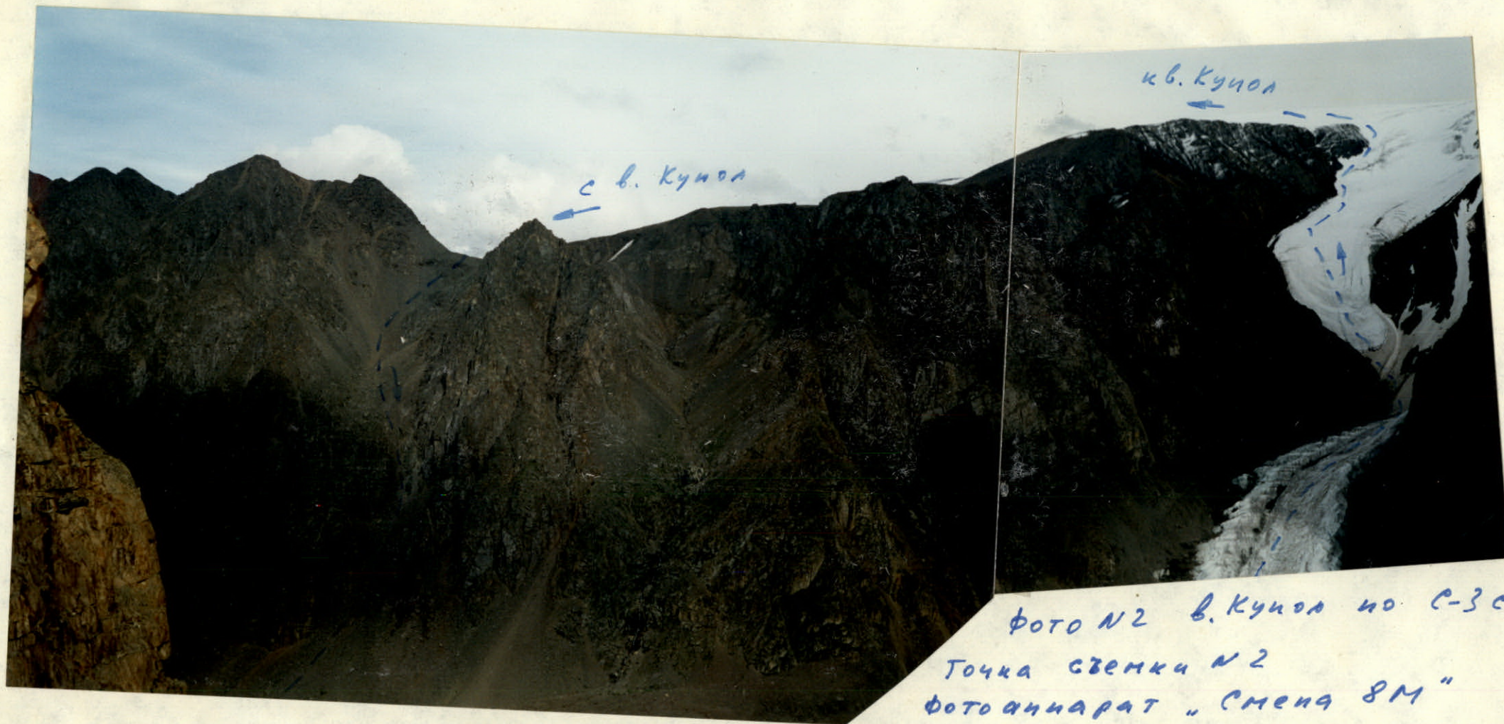
фото №2 в. Кукол по с-з скл Точка съемки №2 фотоаппарат "Смена 8М" объектив ЛОМО Т-43 4/40