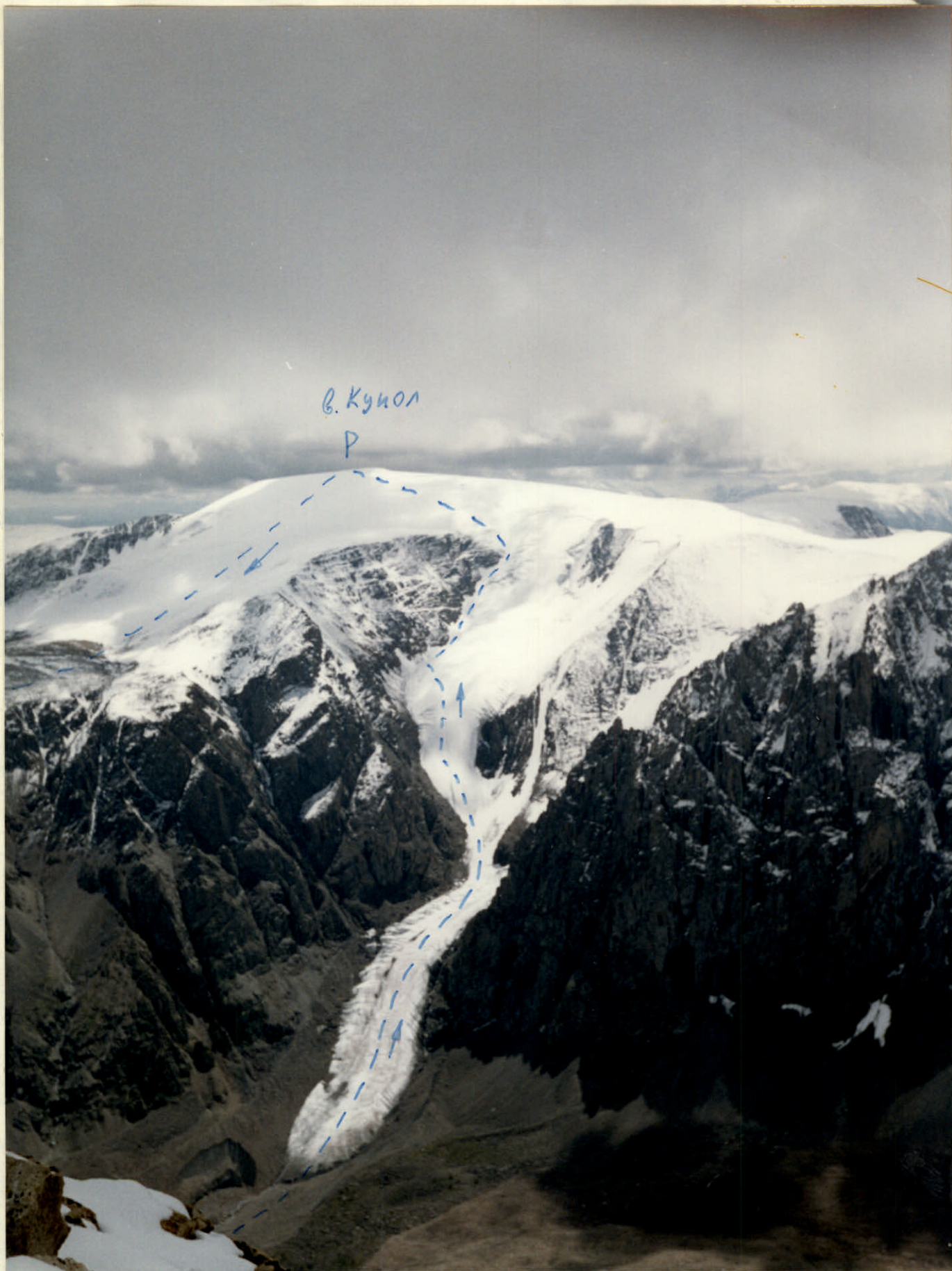
ФОТО №1 В. Кукол по С-З скл Точка съемки №1 фотоаппарат „Смена 8М“ Объектив ЛОМО Т-43 4/40