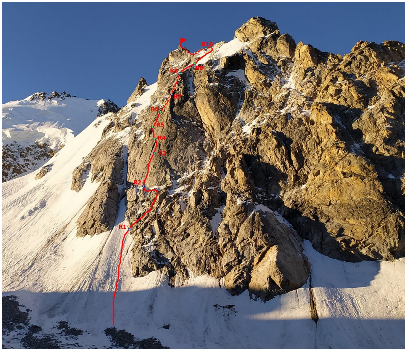
Линия маршрута с обозначенными станциями