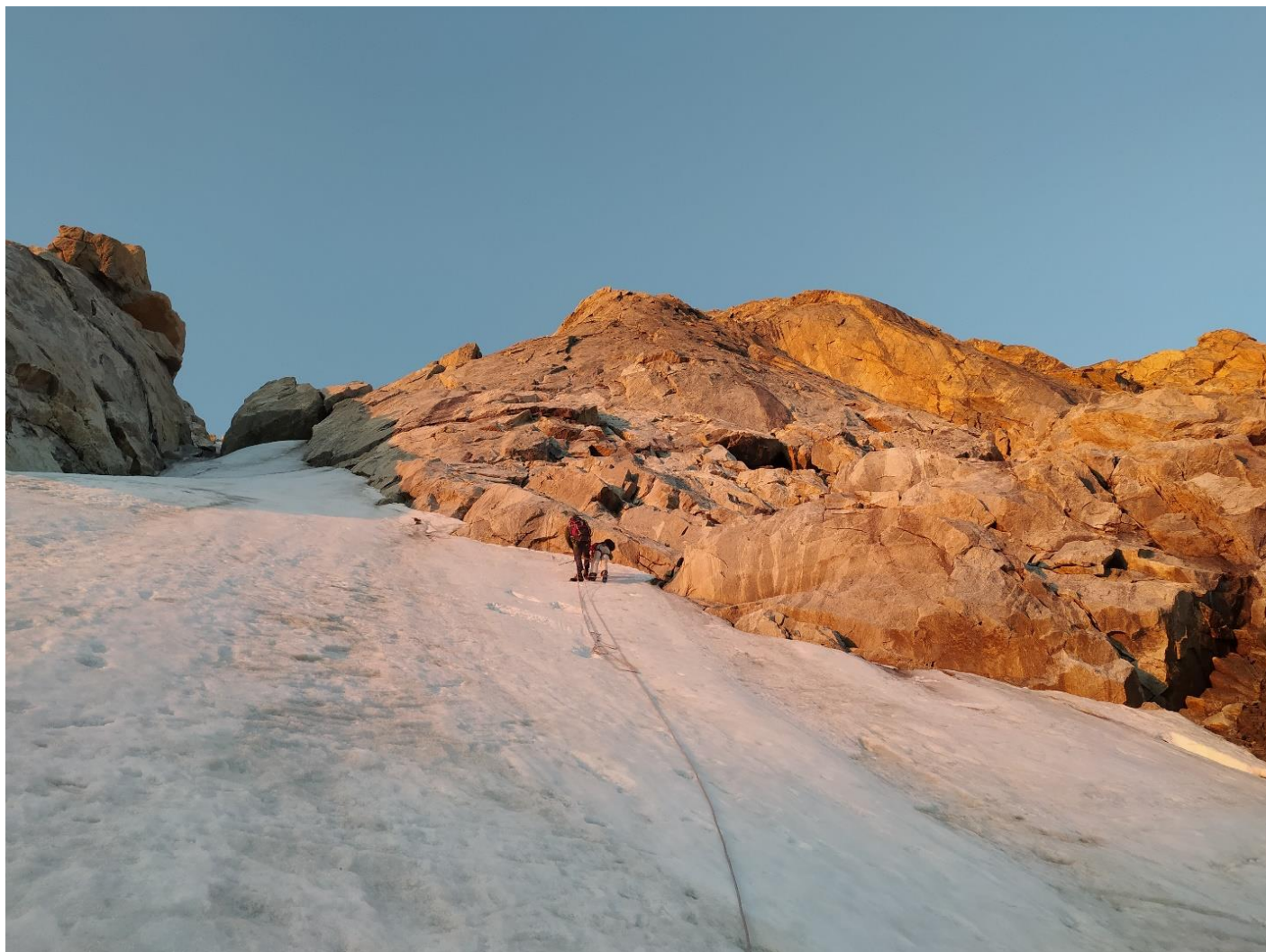
Окончание участка R0-R1. Станция R1