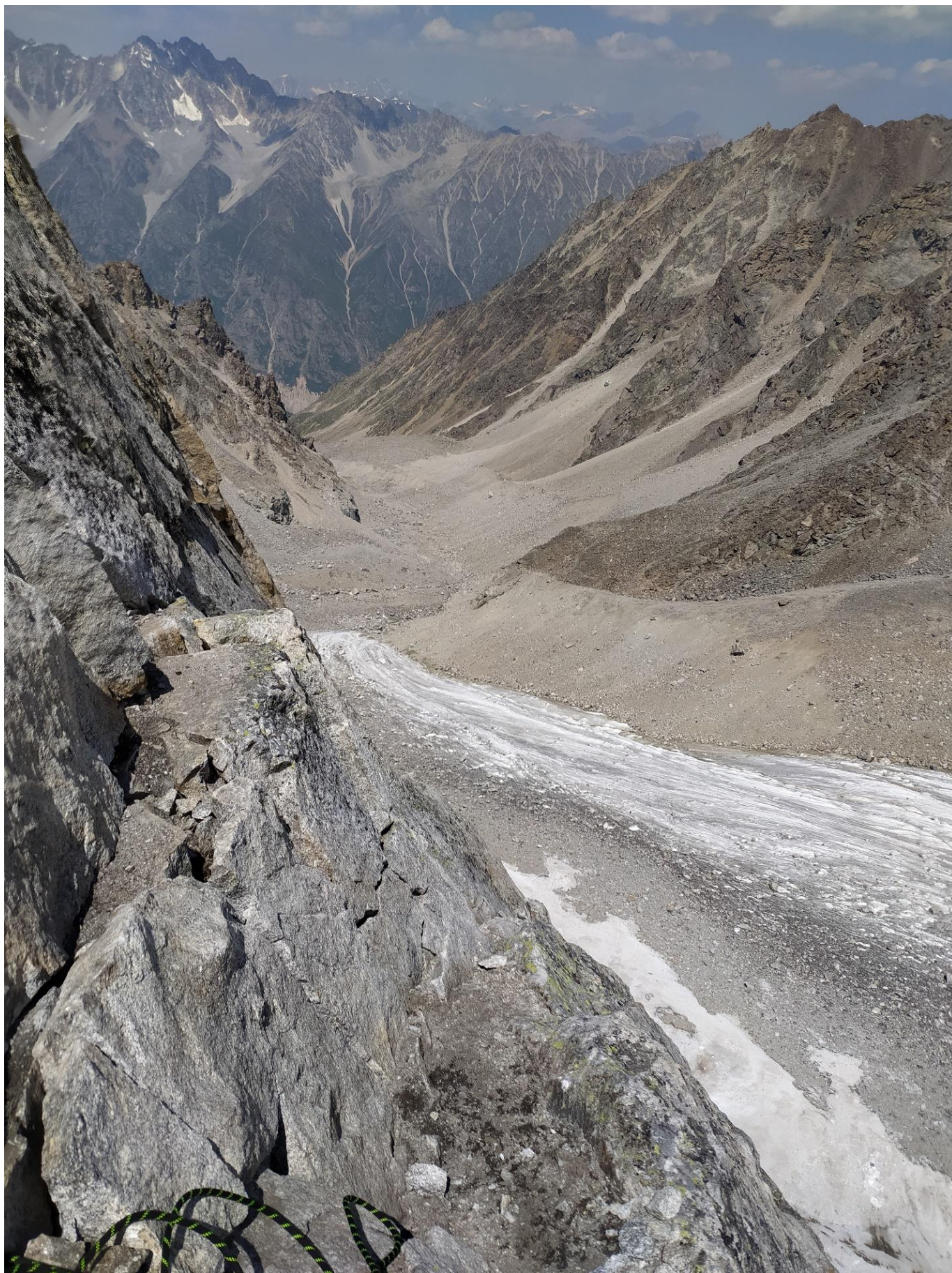
Вид со станции R4