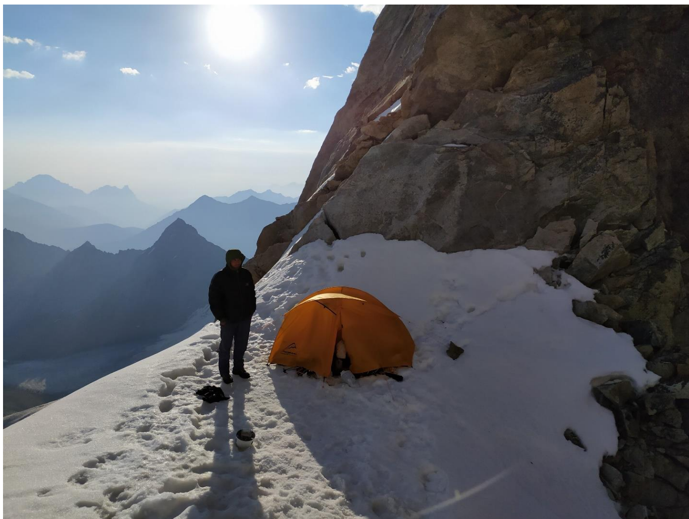
Утром на перемычке между Малым и Восточным Уралом после ночевки