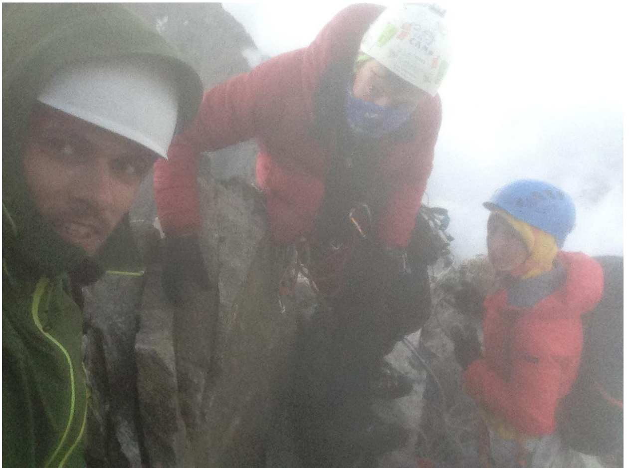
Команда на вершине