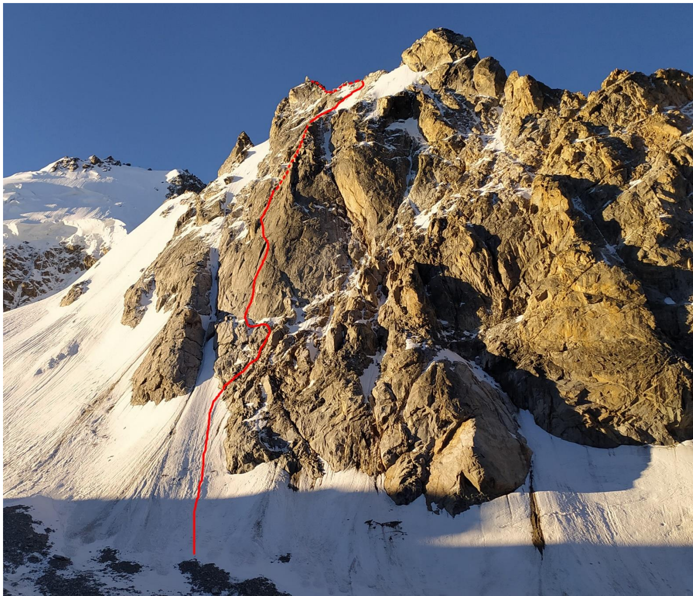
Линия пройденного маршрута